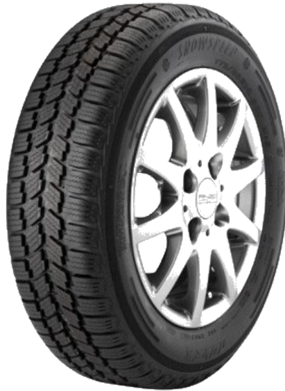
Un pneu avec sa jante.

Le pneu est d'une forme dite « torique » composé de gomme et de plusieurs matériaux. Pour n'importe quel transport utilisé, il sert à rouler, tout simplement. Il entoure la roue pour une meilleure adhésion à la route.