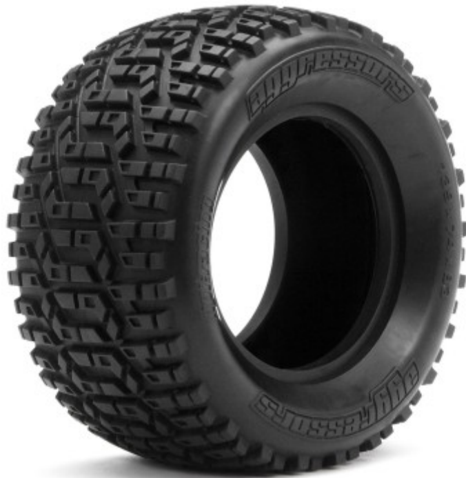
Un pneu pour des « monsters trucks »