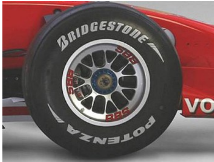
Pneu de F1