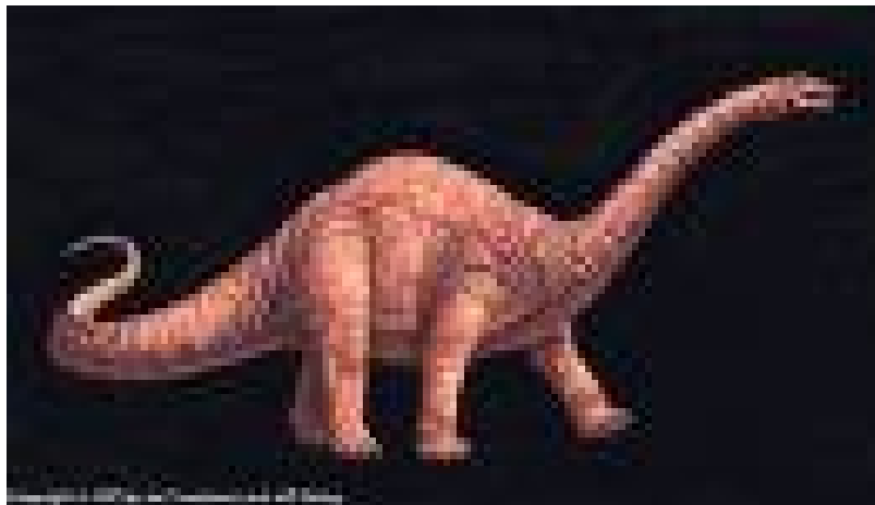
Un herbivore :l'Apatosaurus

Les plantes étant plus difficiles à digérer certains dinosaures avalaient des pierres(gastrolithes) qui une fois dans le gésier broyer les aliments en s'entrechoquant.