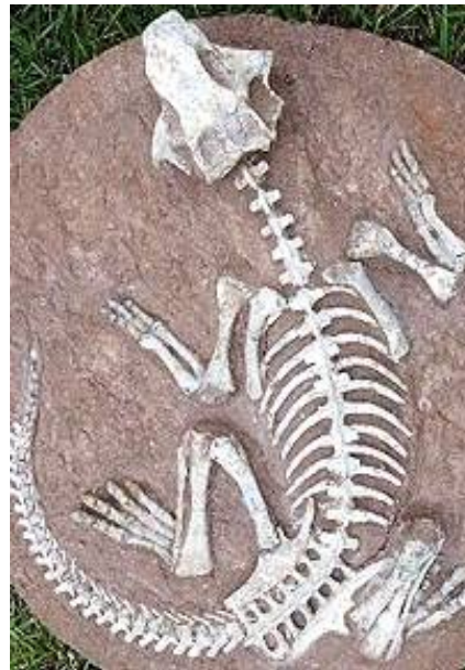
Fossile de Seymouria.