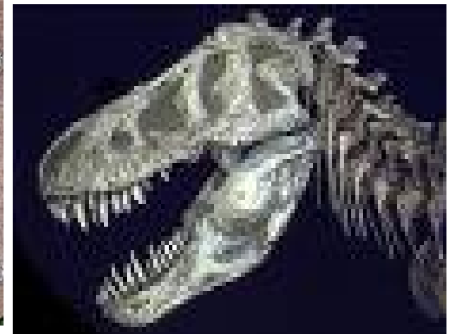
Fossile de tyrannosaure