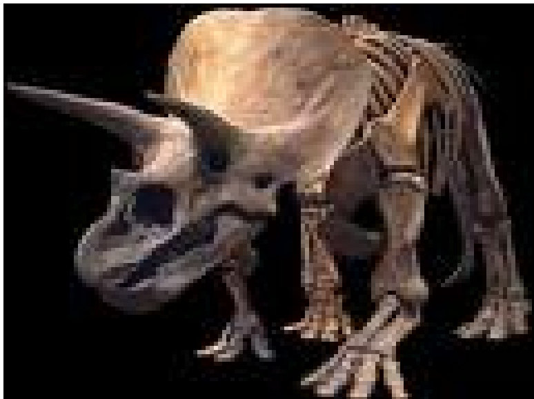
Fossile de tricératops

Des dinosaures ont été conservés sous forme de fossile. L'étude de ces fossiles permet de savoir à quoi ils ressemblaient. La fossilisation n'est généralement possible que si l'animal mort est enfoui dans des sédiments. Grâce aux spécialistes de l'étude des fossiles, les paléontologues, on a pu évaluer la taille et la morphologie de ces dinosaures. Les os de dinosaures nous renseignent sur les différents modes de vie et sur les maladies et les blessures dont ils souffraient. On continue aujourd'hui à découvrir bien des choses à leur sujet.